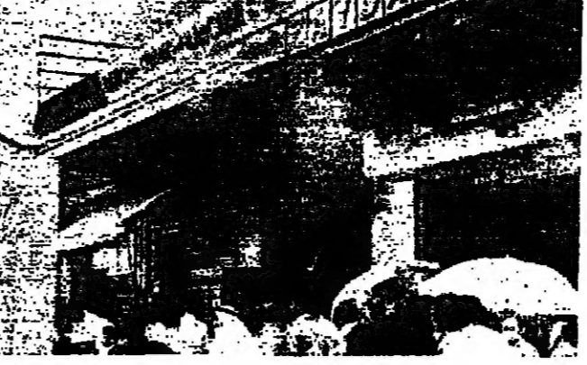
الدخان يملأ المكان من الخدمتة بعد الحريق

حصل حريق في مطعم بصيدا، قرب النهر، أدى إلى إصابة مستخدم بالحروق. وقد تم إخماد الحريق بواسطة رجال الإطفاء.